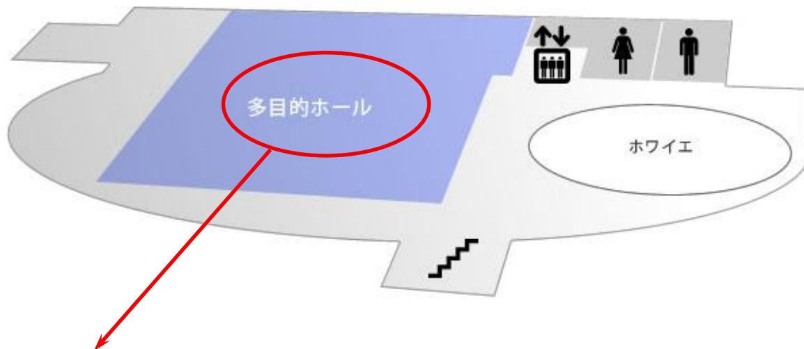
多目的ホール配置図